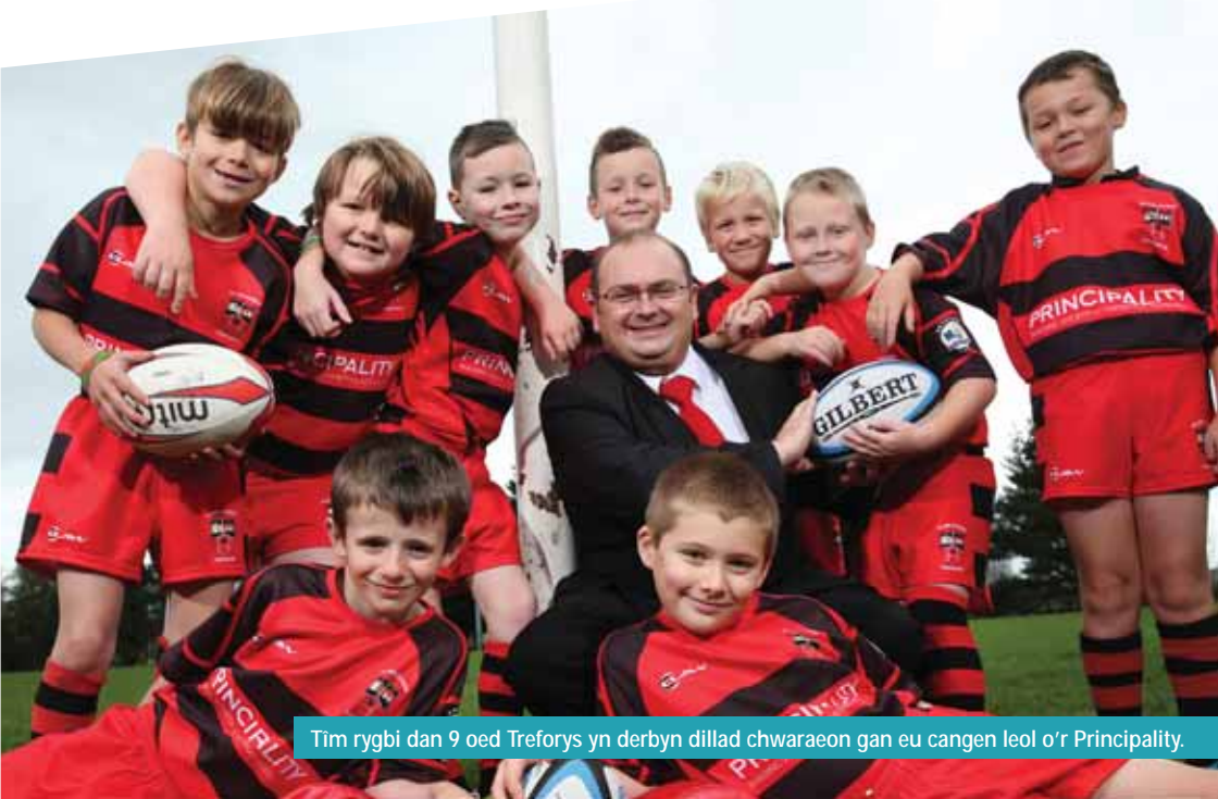
Tim rygbi dan 9 oed Treforys yn derbyn dillad chwaraeon gan eu cangen leol o'r Principality.